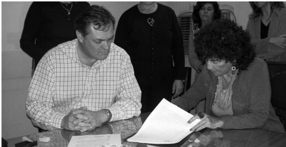
LA FIRMA DEL CONVENIO CON EL MUNICIPIO DE CHAJARÍ fue uno de los acontecimientos más importantes.

2008 ha sido, para la Facultad de Ciencias de la Educación (UNER), un año fructífero. La apertura de la sede en Chajarí, las nuevas carreras de posgrado, la articulación de acciones con otras organizaciones, la mención en un premio presidencial, el lanzamiento de este periódico y la realización del VI Encuentro Nacional de Carreras de Comunicación Social son algunos de los importantes acontecimientos.