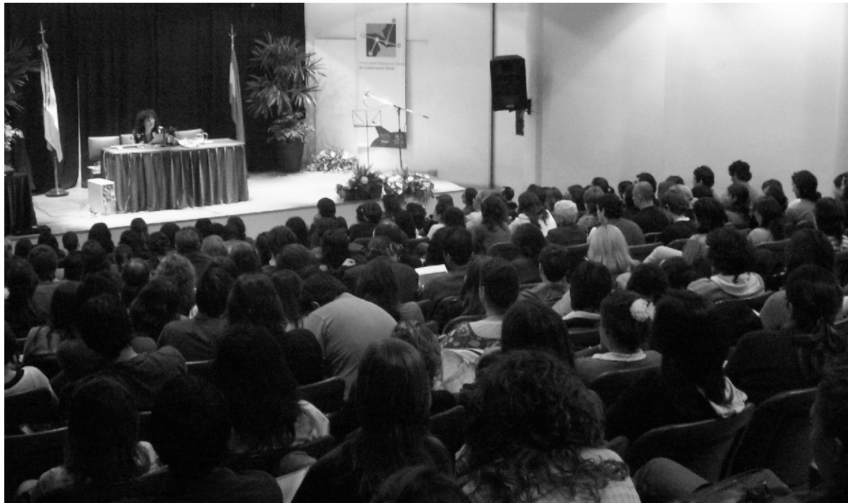
MÁS DE 500 fueron los asistentes al Encuentro que se dieron cita en la Facultad de Ciencias de la Educación.

Del 24 al 26 de septiembre la Facultad de Ciencias de la Educación (UNER) fue anfitriona de la sexta edición del Encuentro Nacional de Carreras de Comunicación Social. Las tecnologías de la información y la comunicación y su incidencia en el campo académico y profesional fueron el eje de debate.